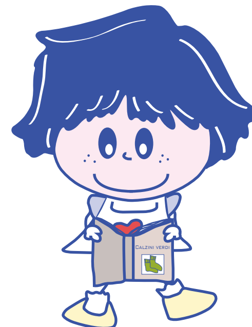
Biblioteca di Verdello

La Biblioteca di tutti sezione di IN-BOOK